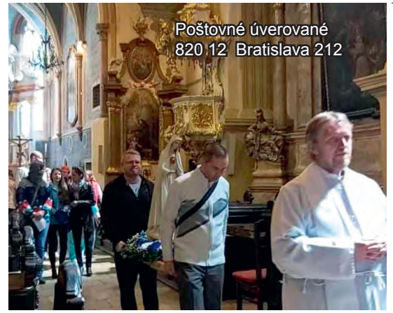
Poštovné úverované 820 12 Bratislava 212