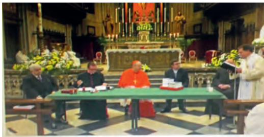
1 maggio 2024 - Apertura della fase diocesana del processo di beatificazione di don Stefano Gobbi