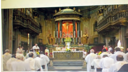
1 maggio 2024 - Apertura della fase diocesana del processo di beatificazione di don Stefano Gobbi