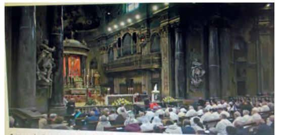
1 maggio 2024 - Apertura della fase diocesana del processo di beatificazione di don Stefano Gobbi