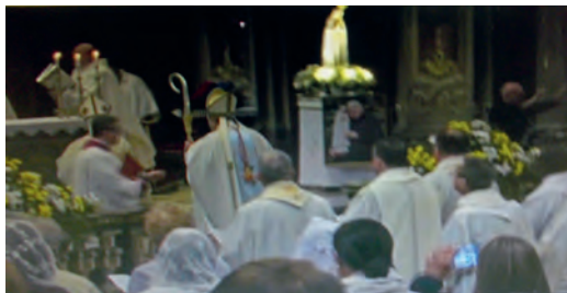
1 maggio 2024 - Apertura della fase diocesana del processo di beatificazione di don Stefano Gobbi