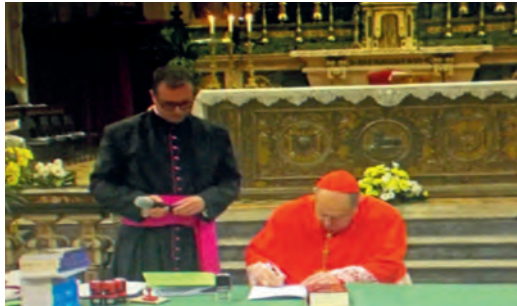
1 maggio 2024 - Apertura della fase diocesana del processo di beatificazione di don Stefano Gobbi