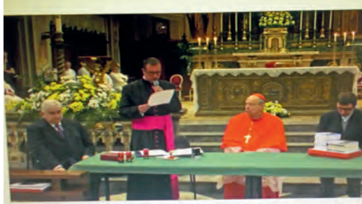
1 maggio 2024 - Apertura della fase diocesana del processo di beatificazione di don Stefano Gobbi